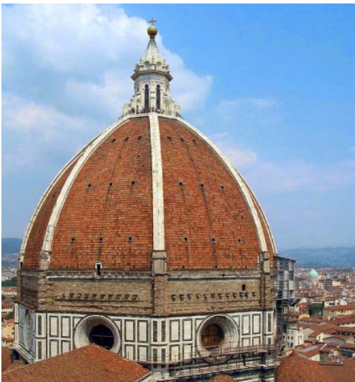
Fig.1 Puntuación máxima: 2 puntos

Analiza y comenta las dos obras de arte presentadas: