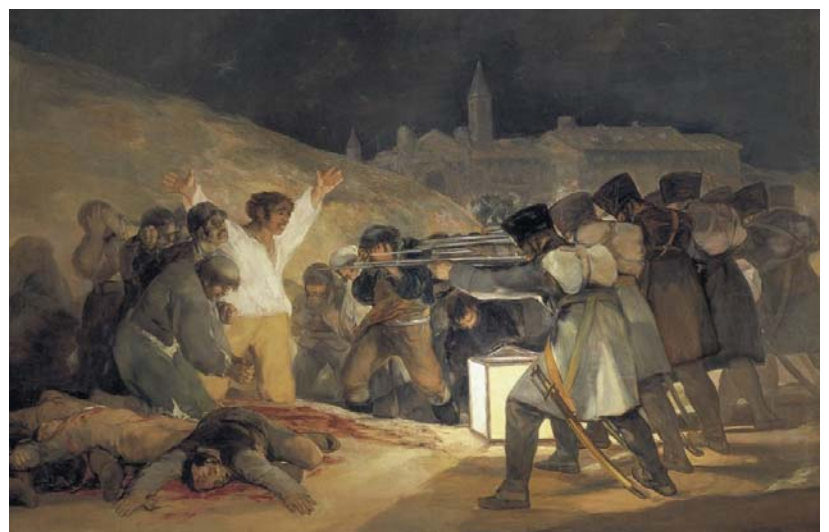
Fig.2 Puntuación máxima: 2 puntos