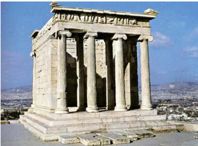
Fig.1 Puntuación máxima: 2 puntos

Analiza y comenta las dos obras de arte presentadas: